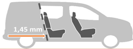
Бокове сидіння складене та відкрите вікно в перегородці